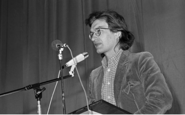
Wim Wenders åbner Reykjavik Film Festival 1978

statsstøtte. Især når konkurrenten hed Hollywood, hvad den fortsat gør for enhver europæisk filmnation, stor som lille.