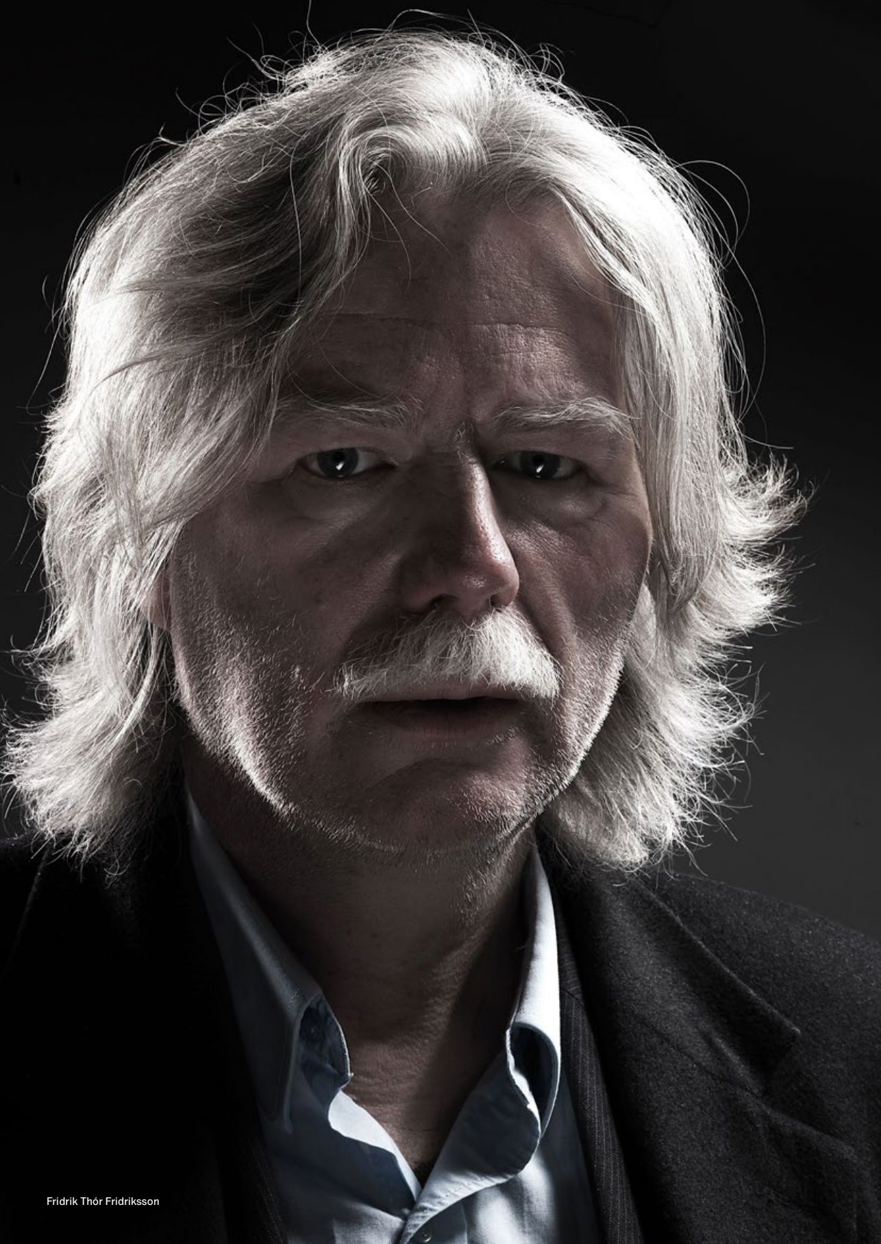
Fridrik Thór Fridriksson