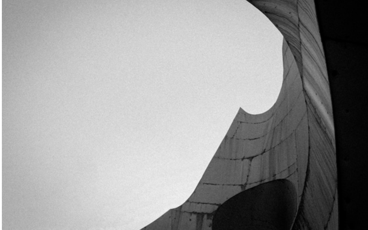
Stillbillede fra 'Last and First Men'

at udforske det monokrome, sterile landskab fra åbningsbilledet (angiveligt optaget omkring kommunistiske monumenter i Balkans bjerge, opført på bestilling af Jugoslaviens præsident, Tito).